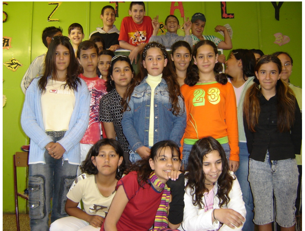
A Magyar Károly Általános Iskola és Zeneiskola növendékei