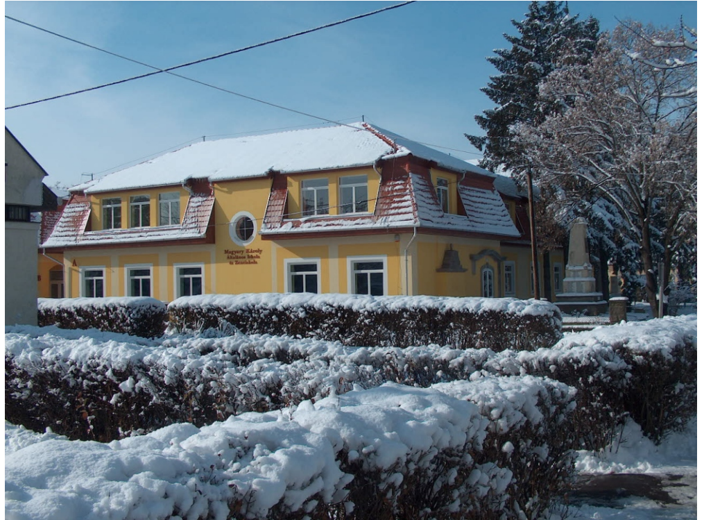
Az Általános Iskola megszépült „A” épülete a kései, márciusi télben